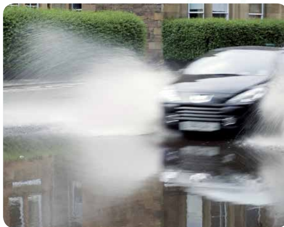
Uponor IQ on sadevesijärjestelmä, joka soveltuu maa- ja metsätalouden, liikenneverkkojen ja kunnallisten hankkeiden käyttöön.

Valitessasi Uponorin saat muutakin kuin turvallisen tuotteen ja varman putkiston. Annamme neuvoja ja teknistä tukea kaikissa vaiheissa suunnittelusta