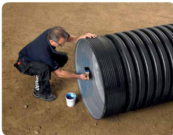
Yksinkertainen asennus, mukautuvuus ja kestävät ominaisuudet ovat avainasioita Uponor IQ -järjestelmässä.

maa- ja vesirakennustöiden valmistumiseen asti. Lisätietoja saat aina myös kotisivuiltamme.