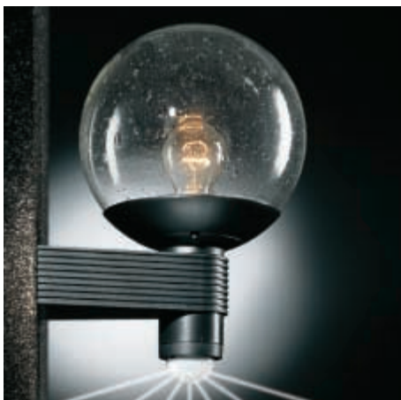
L 400 S musta