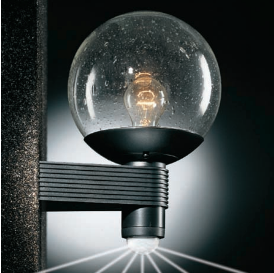
L 400 S musta