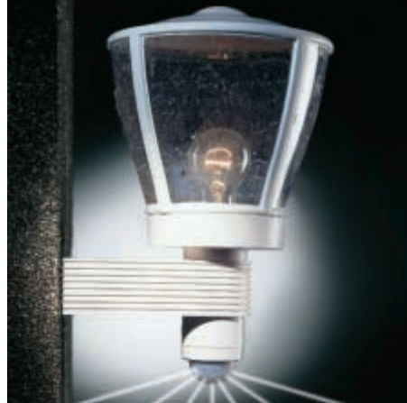
L 430 S valkoinen