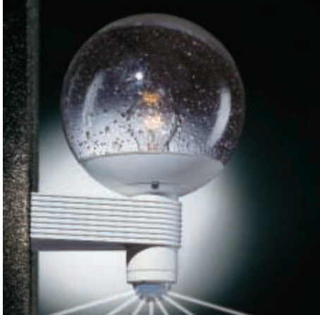
L 400 S valkoinen