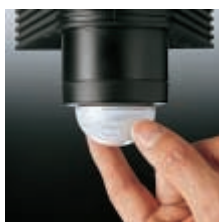
Tunnistin kääntyy kaikkiin suuntiin

Saksalaiset ja kansainväliset hyväksynyt todistavat STEINEL-tunnistinvalaisinten korkean laadun.