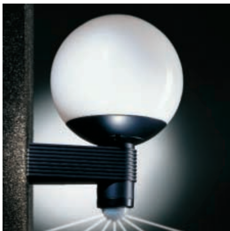
L 410 S musta