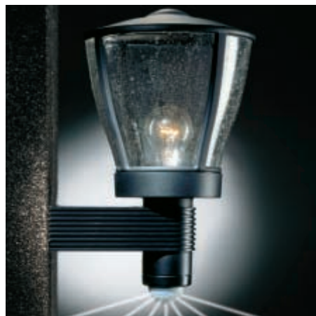
L 430 S musta

Hämäräkytkimen asetusalue on 2 - 2000 luksia. Tällä säädöllä määritellään se hämäryysaste, jossa tunnistinvalaisimen valon tulee syttyä ja sammua.