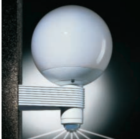
L 410 S valkoinen