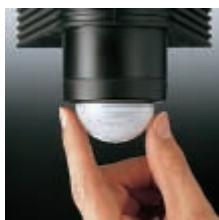
Tunnistusetäisyyden säätö 1 - 12 m