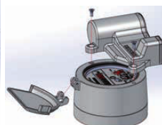
Joonis 5 : EDC-S mooduli paigaldus