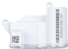
Joonis 3 : Moodul fiksaatorkruvidega (EDC-S) vaskhülsiga arvestitele (IP68).