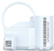
Joonis 2 : Moodul fiksaatorrõnga ja kruviga (EDC-C)

Sõltuvalt arvesti registri versioonist (standard kuivloendur või vaskhülsiga versioon) on olemas kaks erinevat mooduli versiooni.